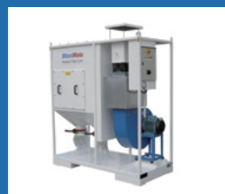
Mobile dust extraction units