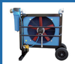
Compressed air aftercoolers